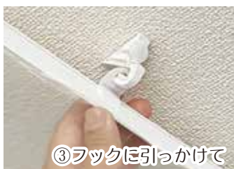
③フックに引っかけて