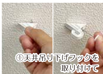
①天井吊り下げフックを取り付けて