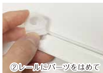
②レールにパーツをはめて